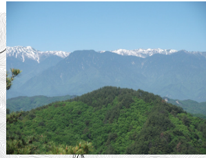
猿ヶ城からの眺望